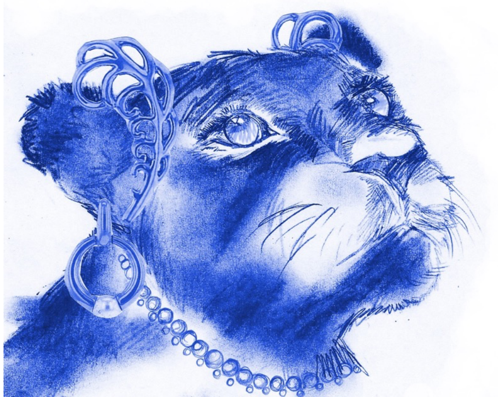
Tekeningen: Aline Breucker

Je kan en mag doen wat je nodig hebt om je goed te voelen.