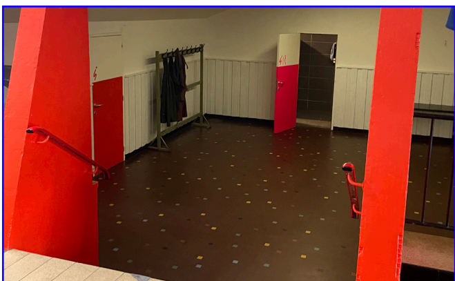
Toiletten (tien traptreden)